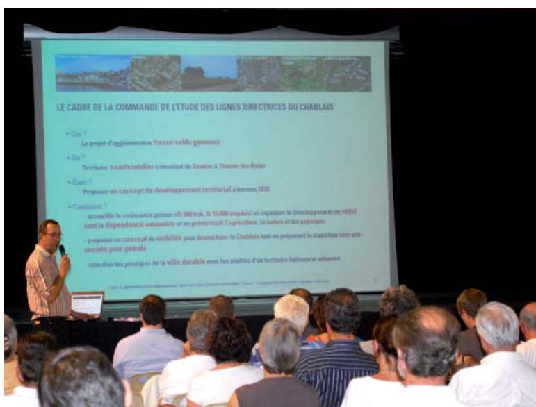
Présentation des résultats Centre d'animation des Crêts à Sciez

Les résultats de l'étude des Lignes directrices du Chablais ont été présentés hier soir à Sciez devant près de 80 personnes. Sur le même principe que les études menées dans les PACA, un bureau d'étude a été mandaté pour tester la capacité d'accueil de ce grand territoire, évaluée à +45'000 habitants et +15'000 emplois à l'horizon 2030.